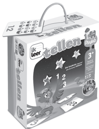
17860 Ik Leer Tellen