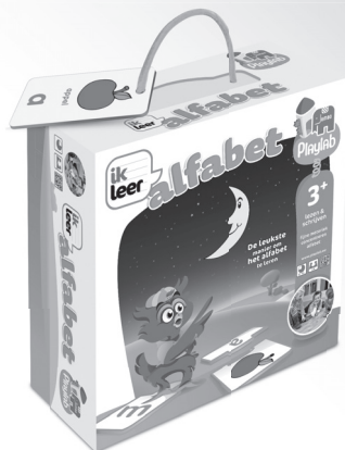
17861 Ik Leer Alfabet