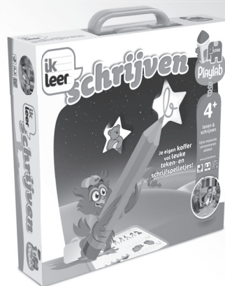
17862 Ik Leer Schrijven