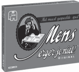
00372 MEJN original