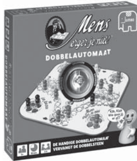
00374 MEJN Dobbelautomaat