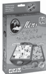
12762 MEJN Travel