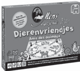
17857 MEJN Dierenvriendjes