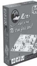
17901 MEJN Compact