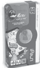
17740 MEJN iPawn

Kijk voor een compleet overzicht van alle Jumbo spellen en verkoopadressen op: www.jumbo.eu