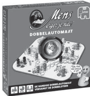
00374 MEJN Dobbelautoomaat

Ook verkrijgbaar Egalement disponibles :