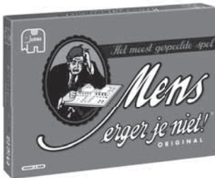
00372 MEJN original