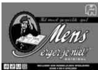
00372 MEJN original