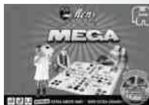
18184 MEJN Mega