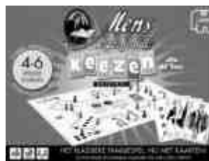
18143 MEJN Keezen

Kijk voor een compleet overzicht van alle Jumbo spellen en verkoopadressen op: www.jumbo.eu