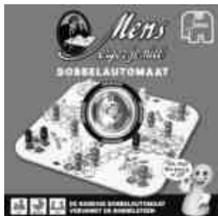
00374 MEJN Dobbelautomaat