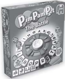
17729 PPP The Battle