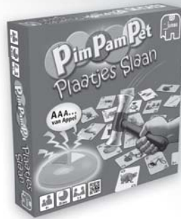
17855 PPP Plaatjes Slaan

Kijk voor een compleet overzicht van alle Jumbo spellen en verkoopadressen op: www.jumbo.eu