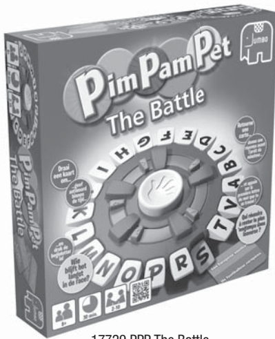
17729 PPP The Battle