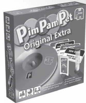
17859 PPP Original Extra

Kijk voor een compleet overzicht van alle Jumbo spellen en verkoopadressen op: www.jumbo.eu