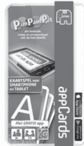
17780 PPP AppCards