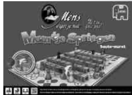
Mens Erger Je Niet! Muurtje Springen 18128